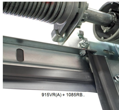
915VR(A) + 1085RB..